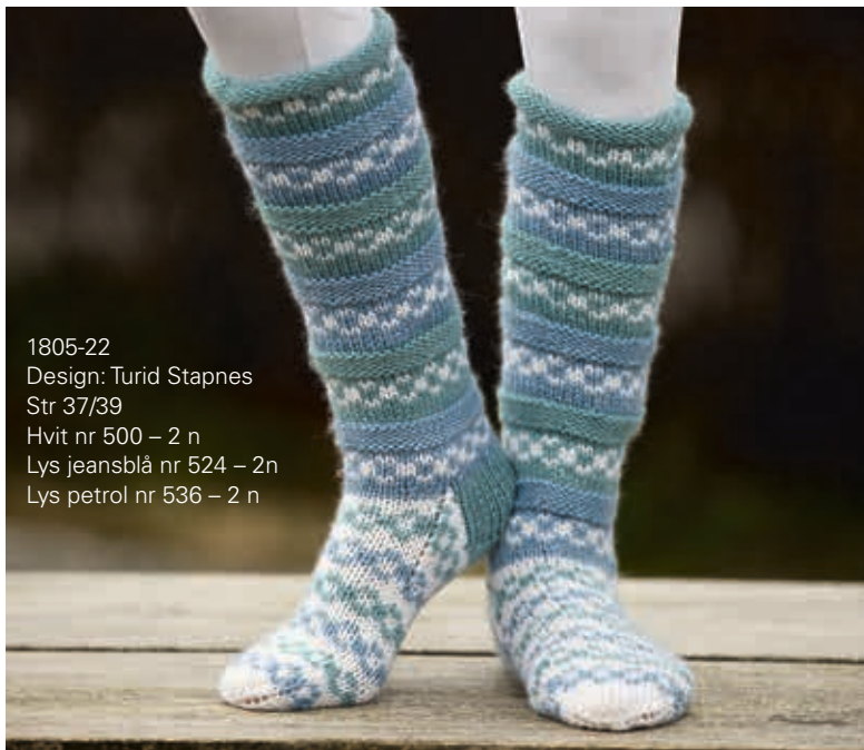
1805-22 Design: Turid Stapnes Str 37/39 Hvit nr 500 – 2 n Lys jeansblå nr 524 – 2n Lys petrol nr 536 – 2 n