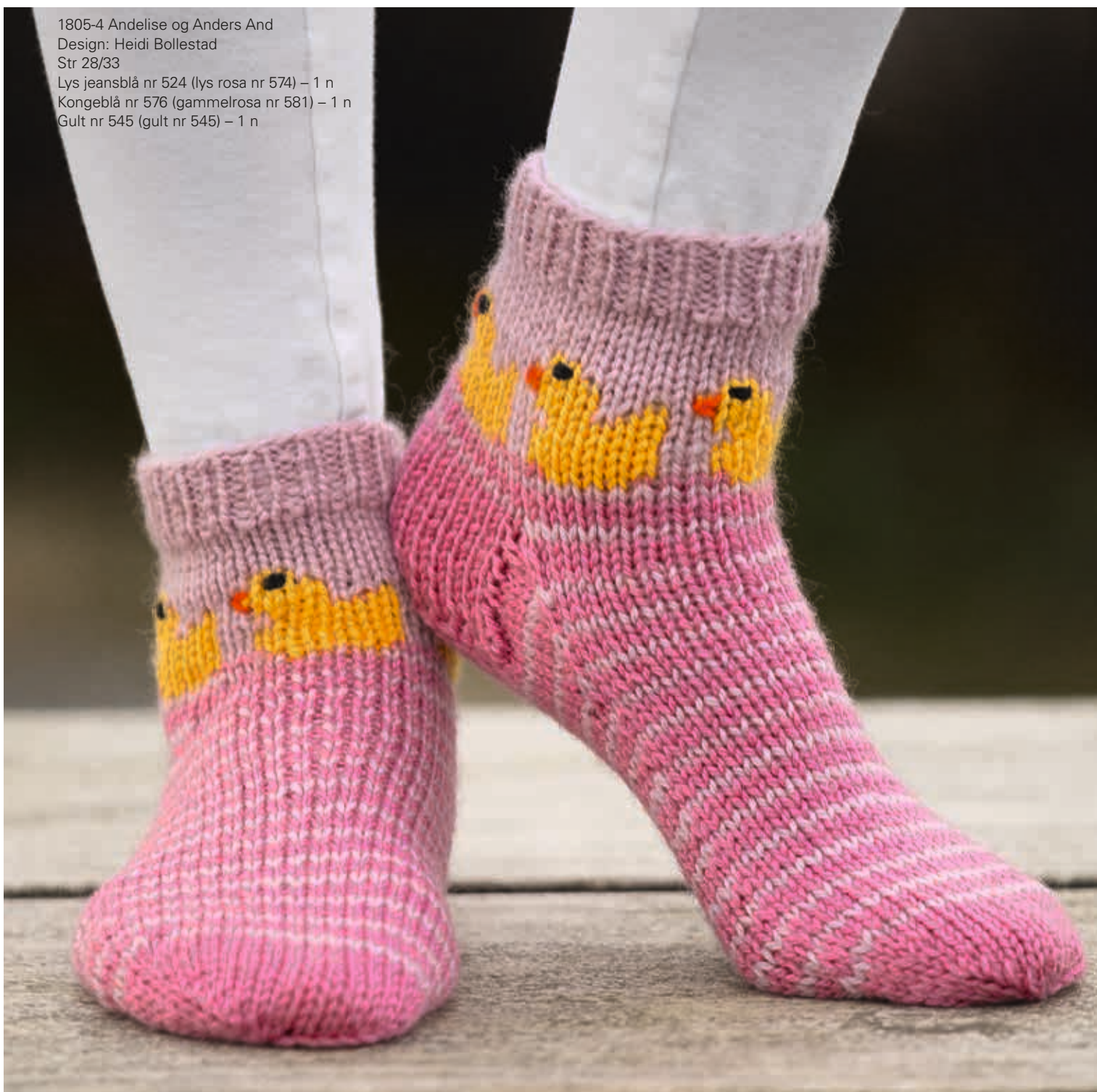
1805-4 Andelise og Anders And Design: Heidi Bollestad Str 28/33 Lys jeansblå nr 524 (lys rosa nr 574) – 1 n Kongebå nr 576 (gammelrosa nr 581) – 1 n Gult nr 545 (gult nr 545) – 1 n