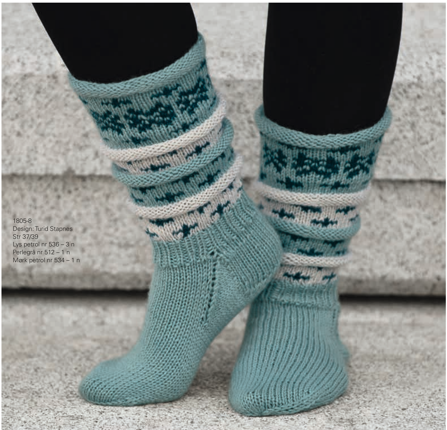
1805-8 Design: Turid Stapnes Str 37/39 Lys petrol nr 536 – 3 n Perlegrå nr 512 – 1 n Mørk petrol nr 534 – 1 n