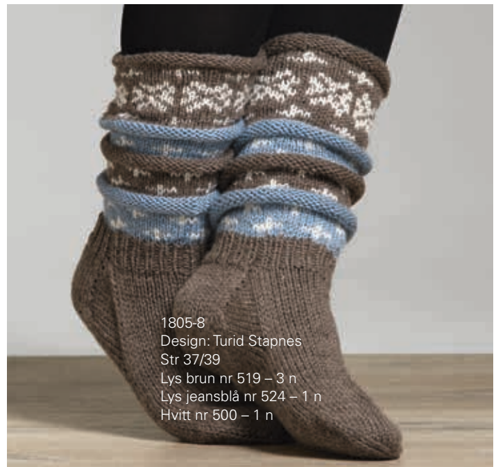
1805-8 Design: Turid Stapnes Str 37/39 Lys brun nr 519 – 3 n Lys jeansblå nr 524 – 1 n Hvitt nr 500 – 1 n