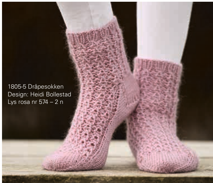
1805-5 Dråpesokken Design: Heidi Bollestad Lys rosa nr 574 – 2 n