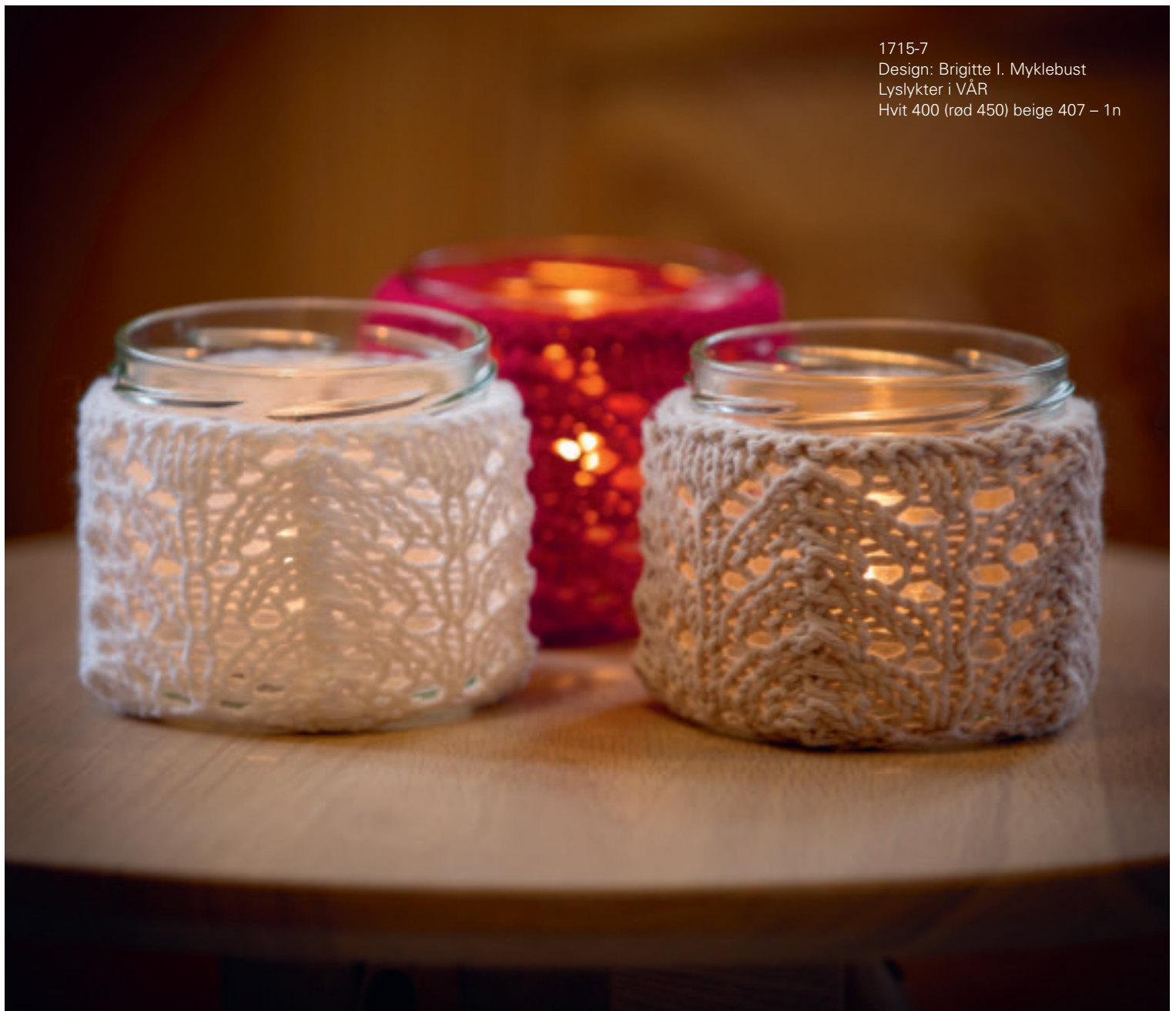
1715-7 Design: Brigitte I. Myklebust Lyslykter i VÅR Hvit 400 (rød 450) beige 407 – 1n