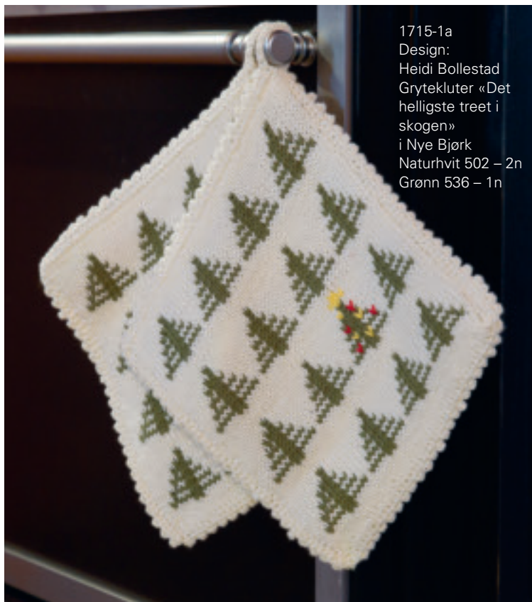
1715-1a Design: Heidi Bollestad Grytekluter «Det helligste treet i skogen» i Nye Bjørk Naturhvit 502 – 2n Grønn 536 – 1n