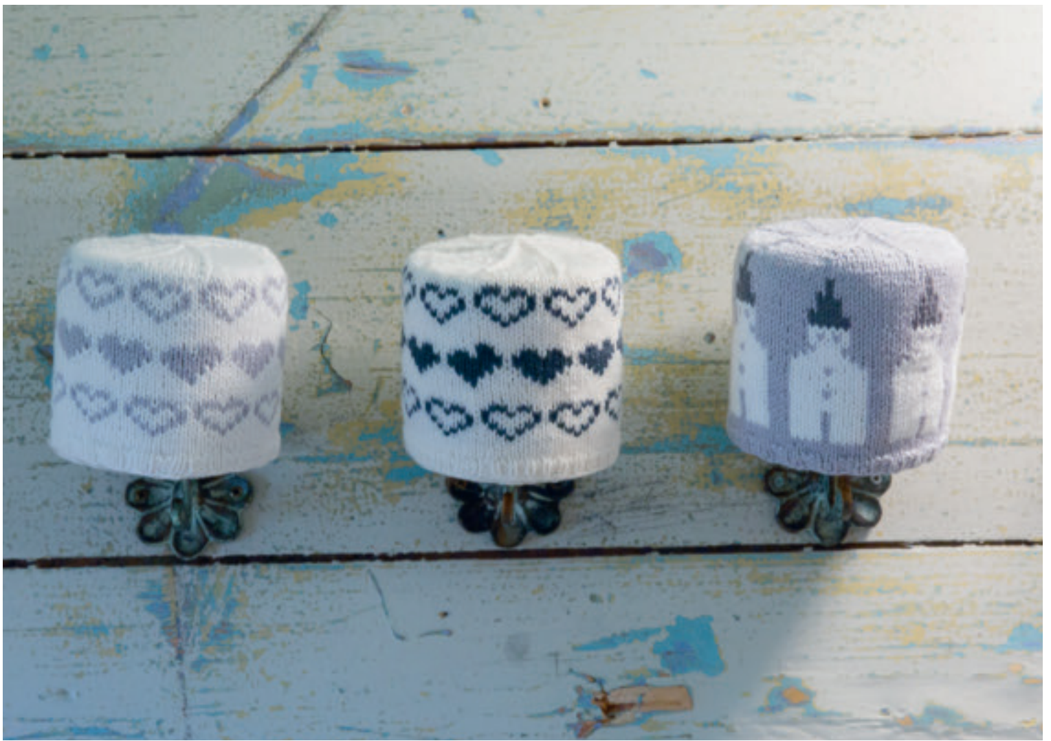
1715-26 Design: Else Tollaksen Dorulltrekk i Nye Bjørk Hvit 500 (lys grå 513) – 1n Lys grå 513 (grå 515) hvit 500 – 1n