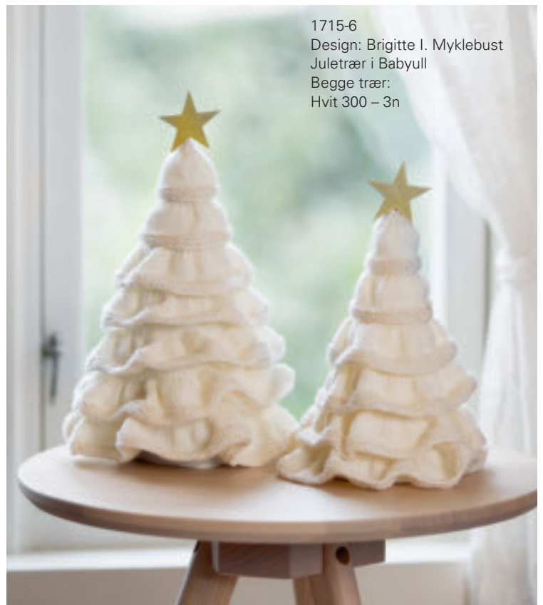
1715-6 Design: Brigitte I. Myklebust Juletrær i Babyull Begge trær: Hvit 300 – 3n