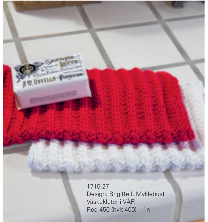
1715-27 Design: Brigitte I. Myklebust Vaskekluter i VÅR Rød 450 (hvit 400) – 1n