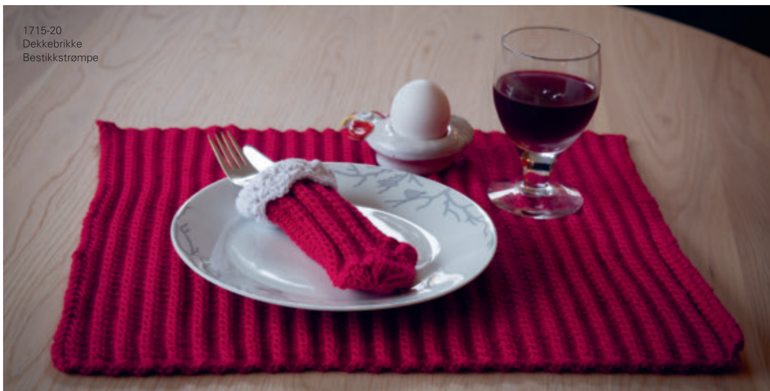
1715-20 Dekkebrikke Bestikkstrømpe

Bestikkstrømpe Rød 450 – 1n Hvit 400 – 1n