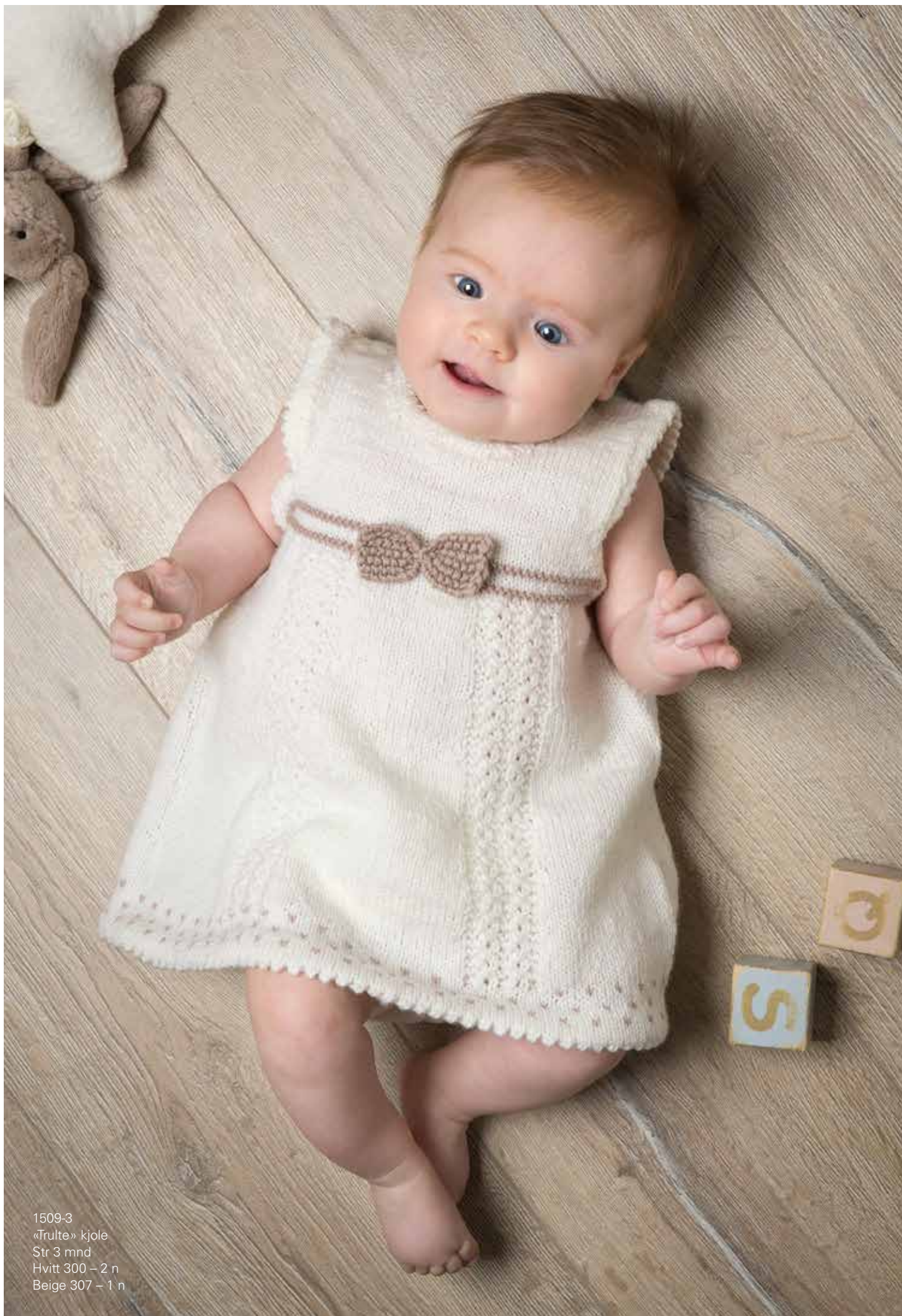
1509-3 «Trulte» kjole Str 3 mnd Hvitt 300 – 2 n Beige 307 – 1 n