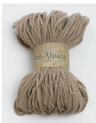
407 Lys Beige