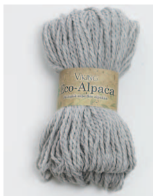
413 Lys Grått