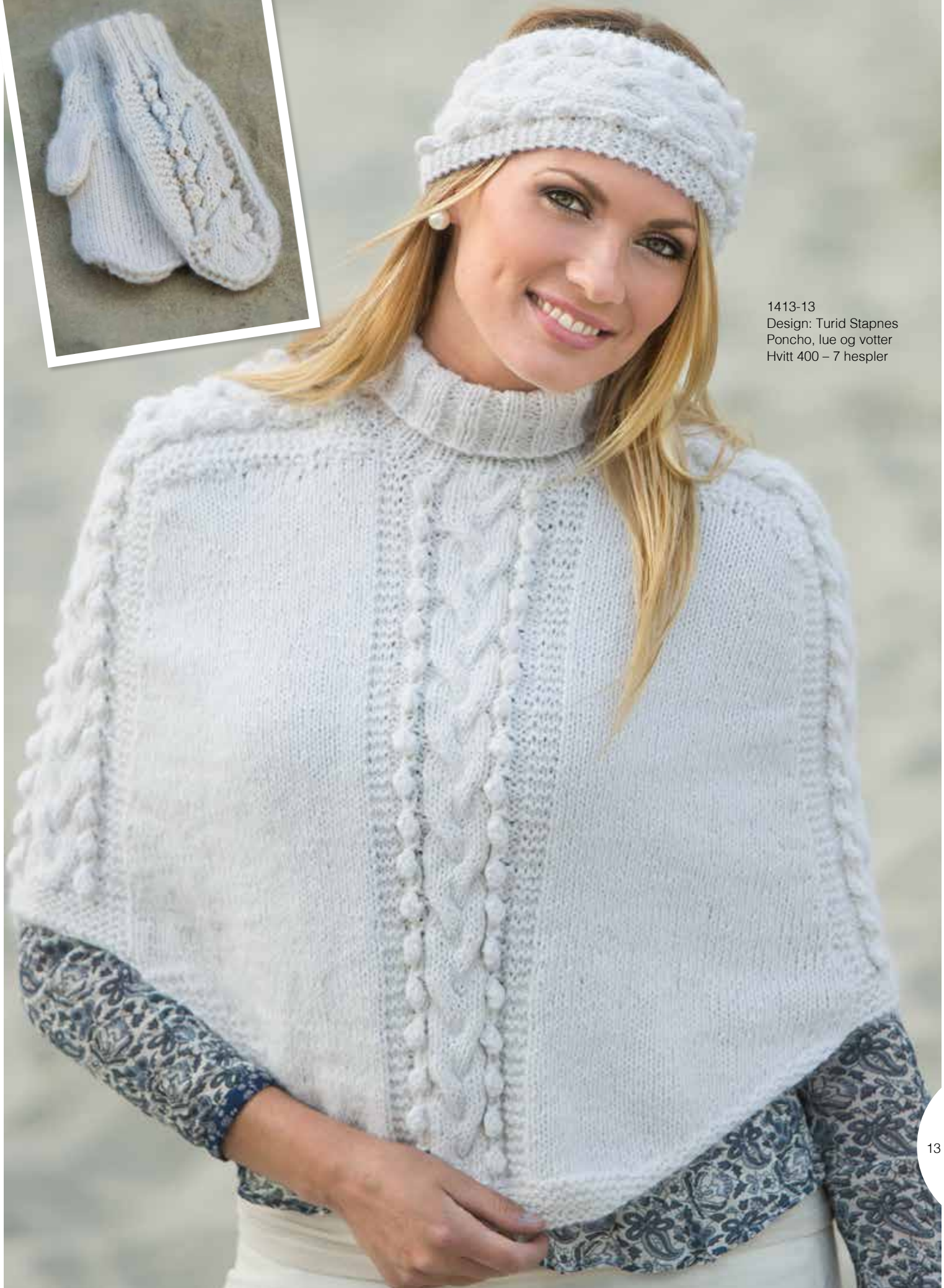
1413-13 Design: Turid Stapnes Poncho, lue og votter Hvitt 400 – 7 hespler