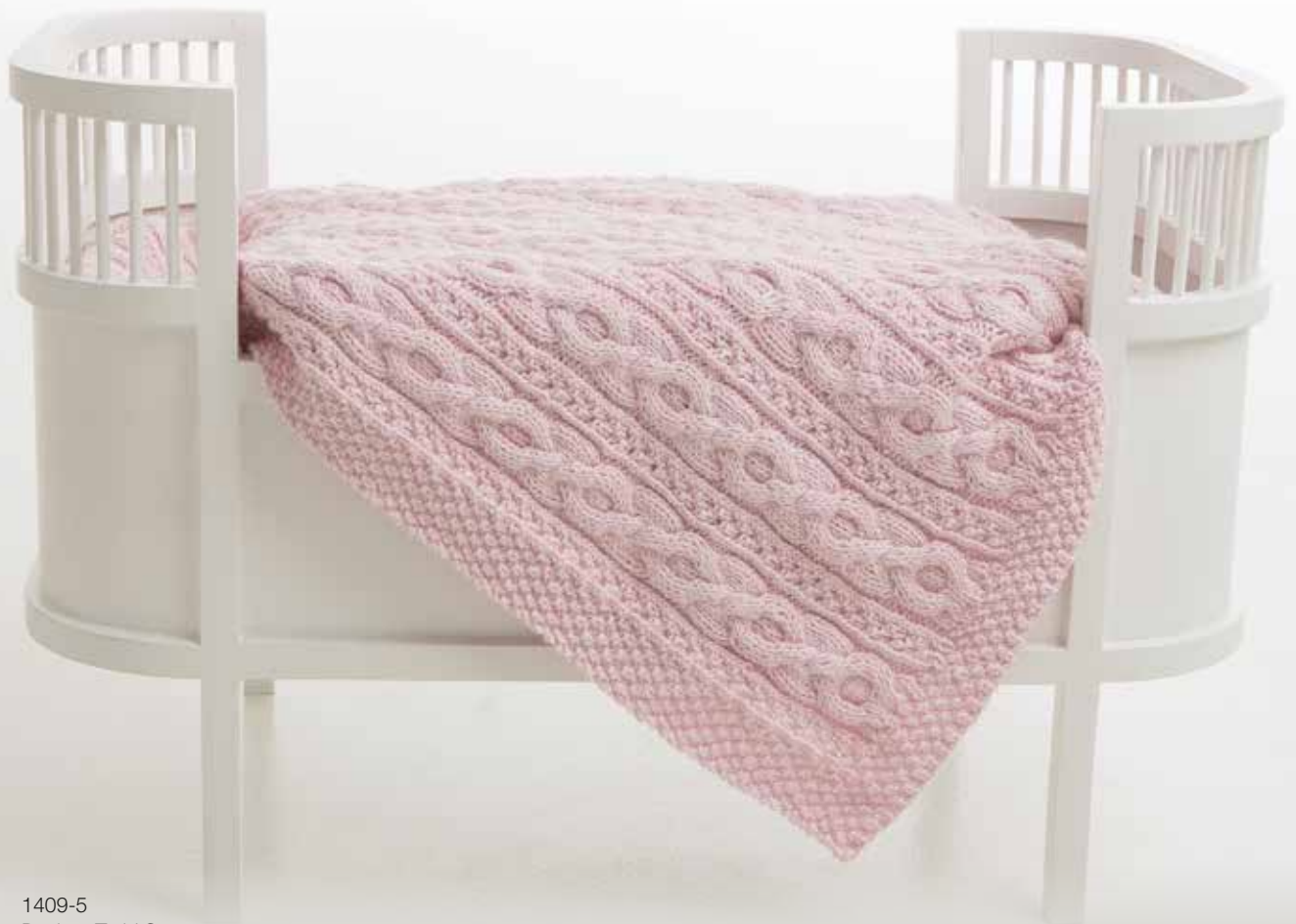
1409-5 Design: Turid Stapnes Vognteppe Lys rosa 565 – 5 nøster