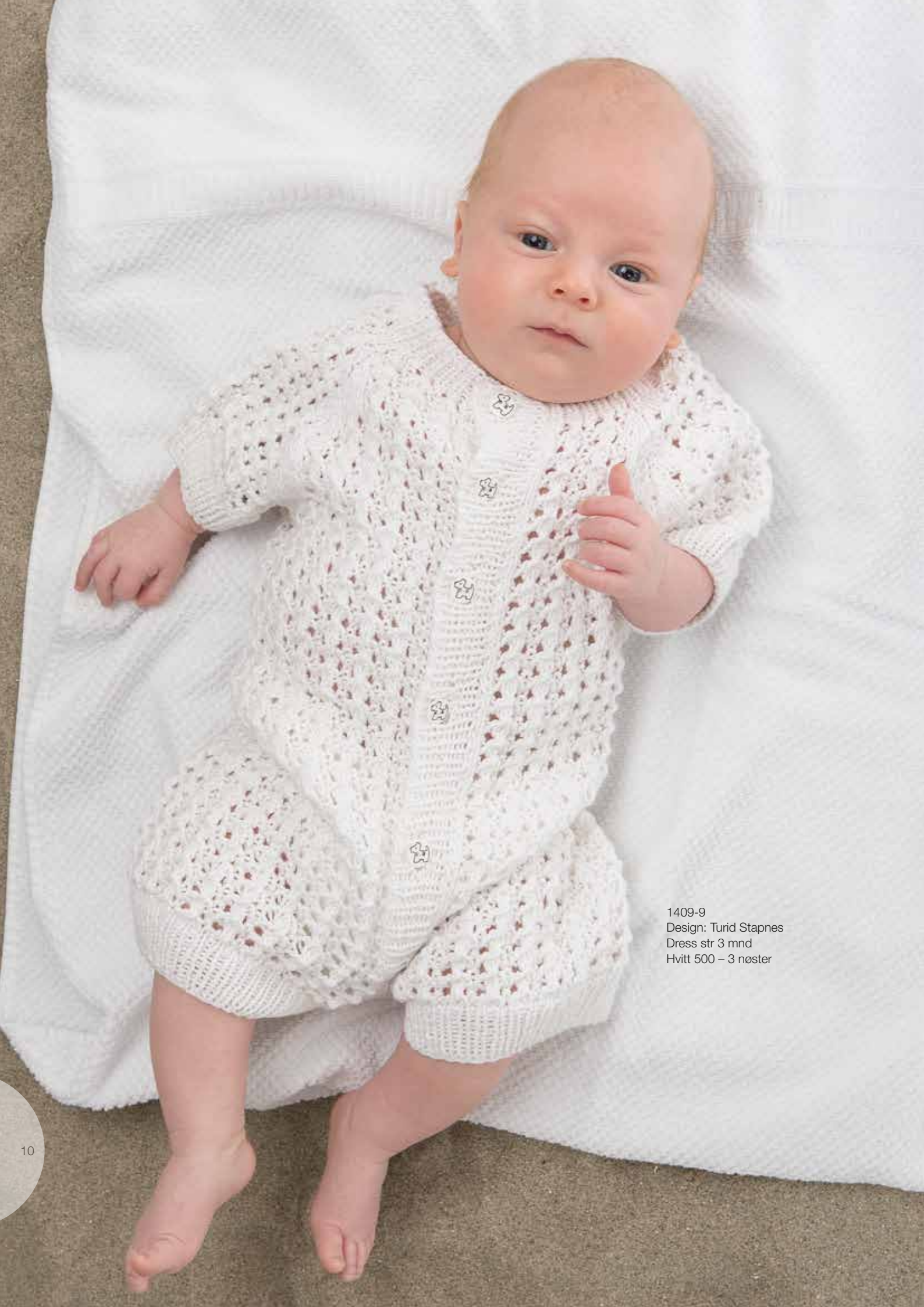
1409-9 Design: Turid Stapnes Dress str 3 mnd Hvitt 500 – 3 nøster