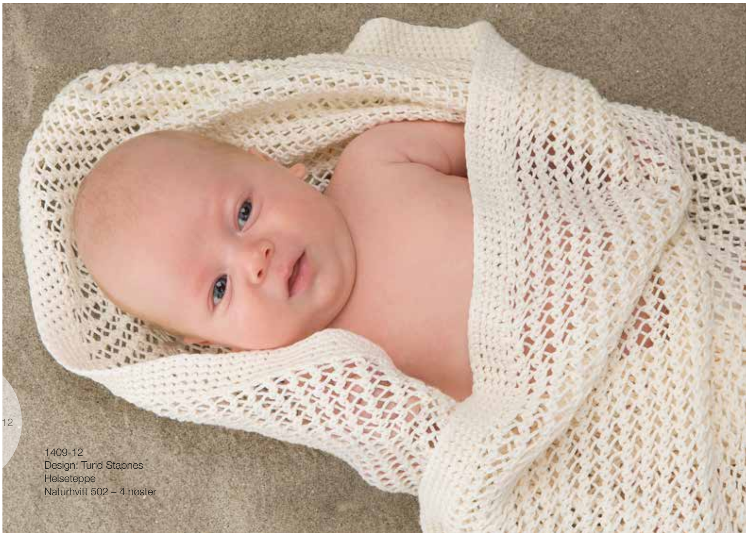
1409-12 Design: Turid Stapnes Helseteppe Naturhvitt 502 – 4 nøster