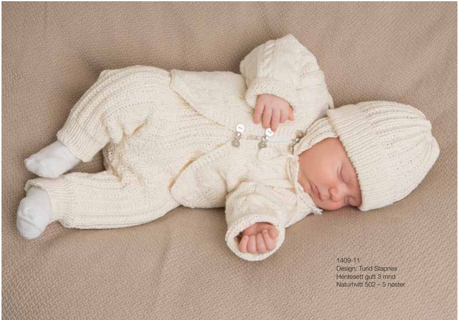
1409-11 Design: Turid Stapnes Hentesett gutt 3 mnd Naturhvitt 502 – 5 nøster