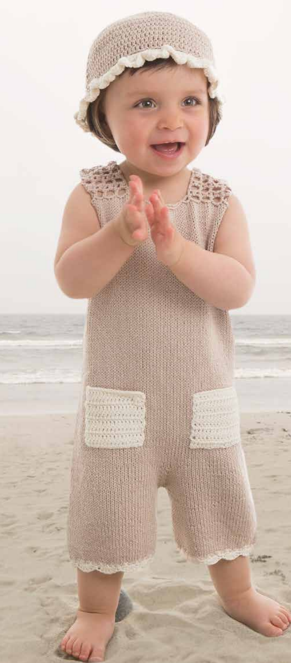
1409-1B Design: Elin Sørung Dress og hatt str 1 år Beige 507 – 4 nøster Naturhvitt 502 - 1 nøste