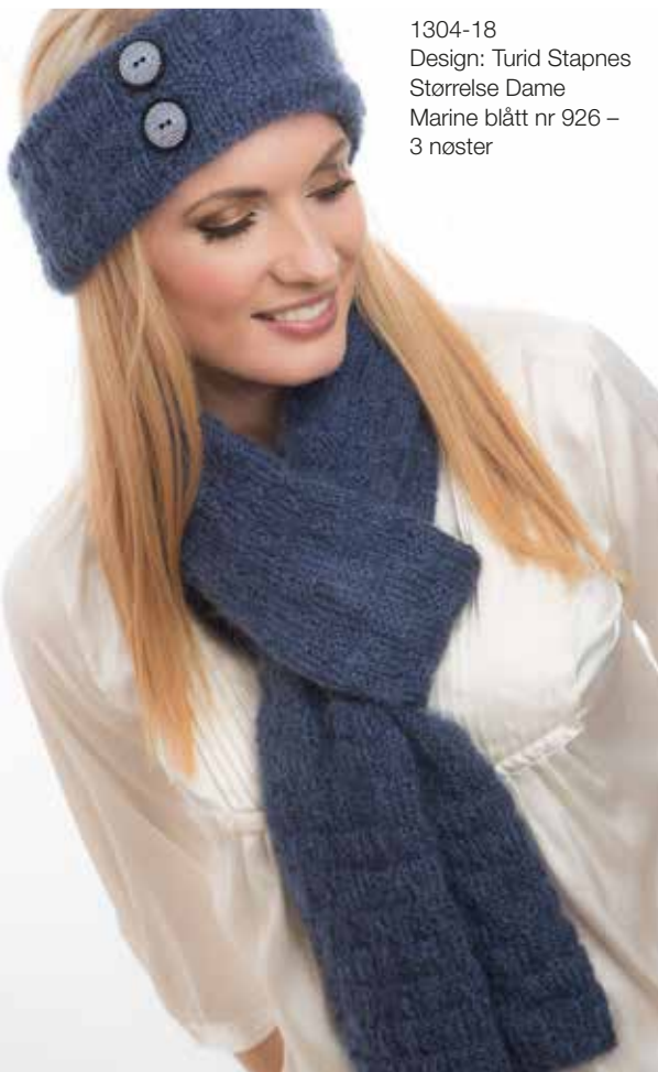
1304-18 Design: Turid Stapnes Størrelse Dame Marine blått nr 926 – 3 nøster