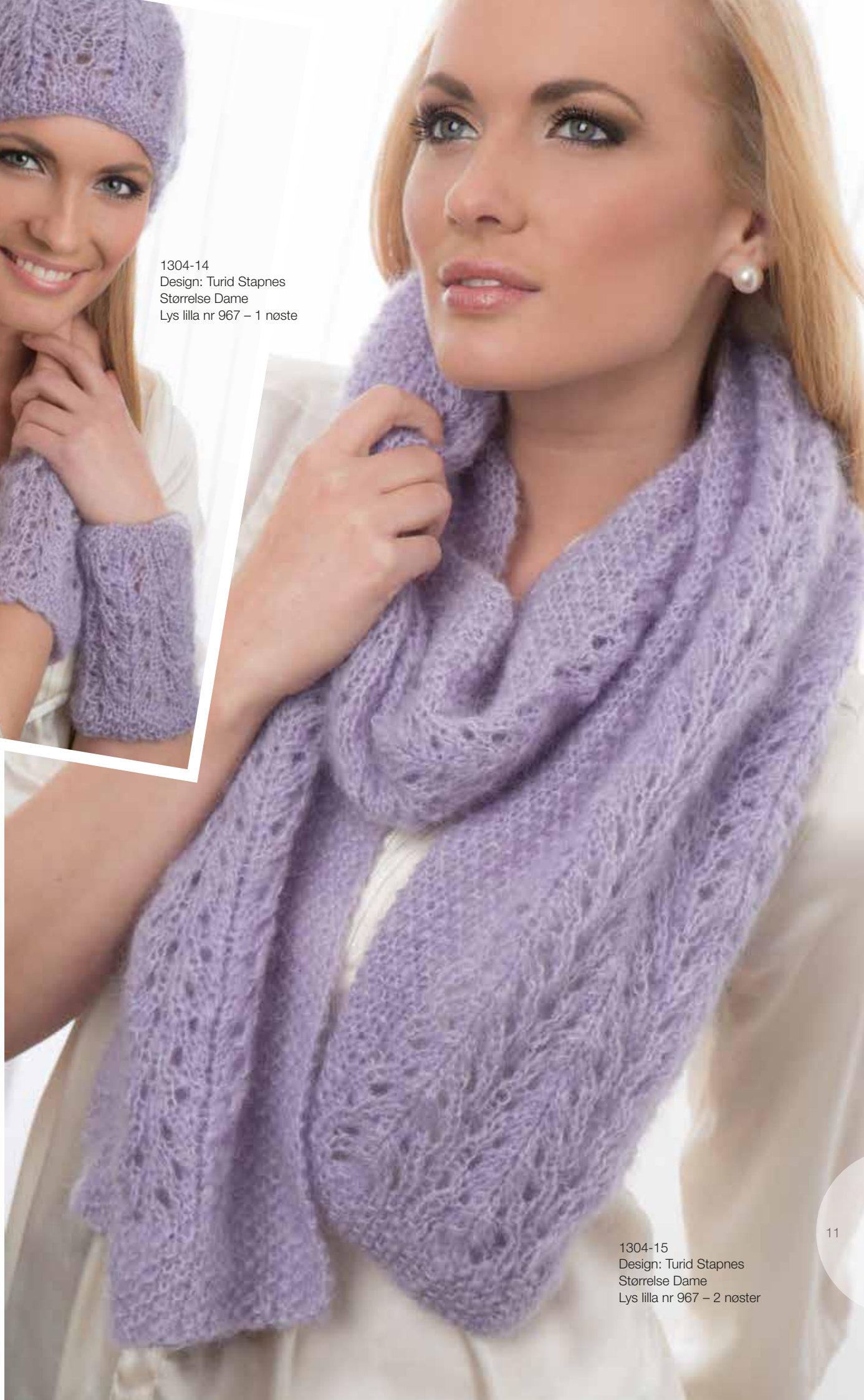
1304-15 Design: Turid Stapnes Størrelse Dame Lys lilla nr 967 – 2 nøster