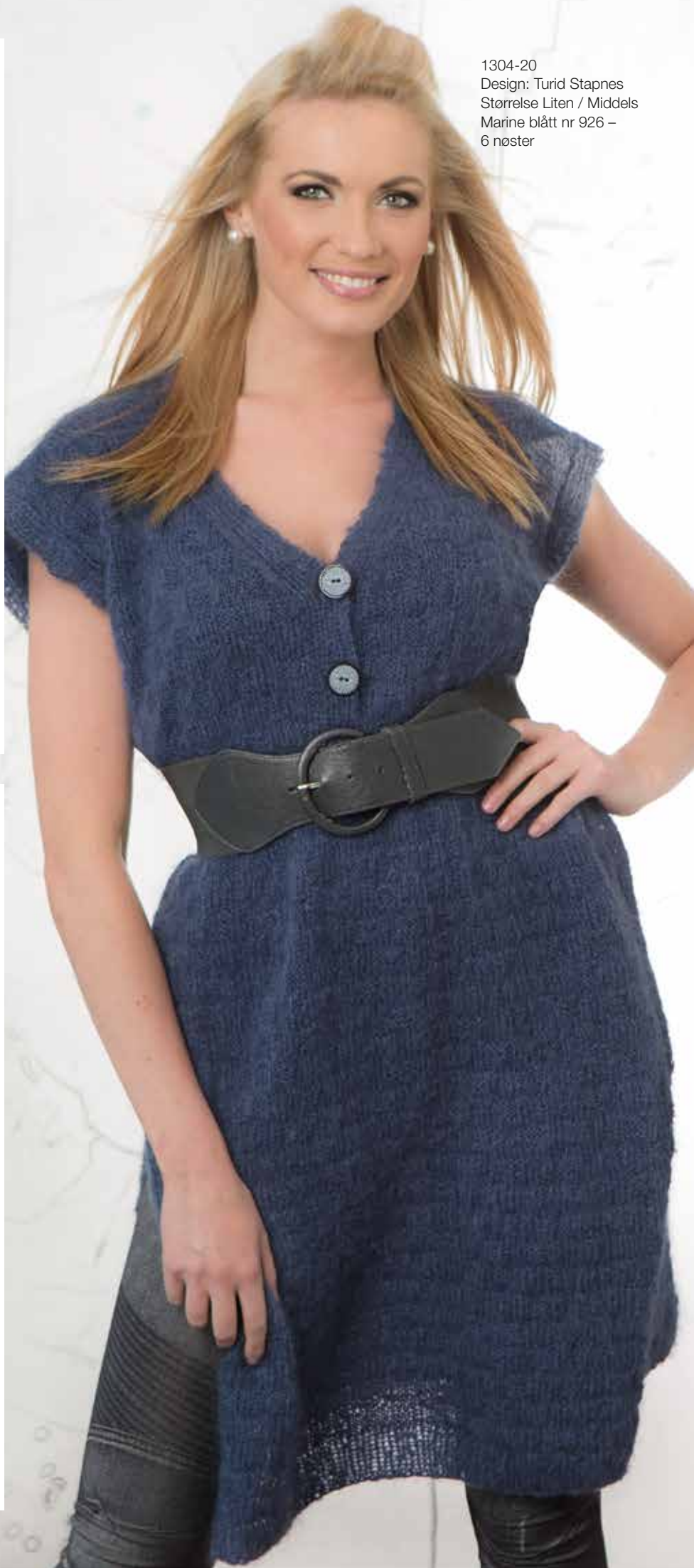
1304-20 Design: Turid Stapnes Størrelse Liten / Middels Marine blått nr 926 – 6 nøster