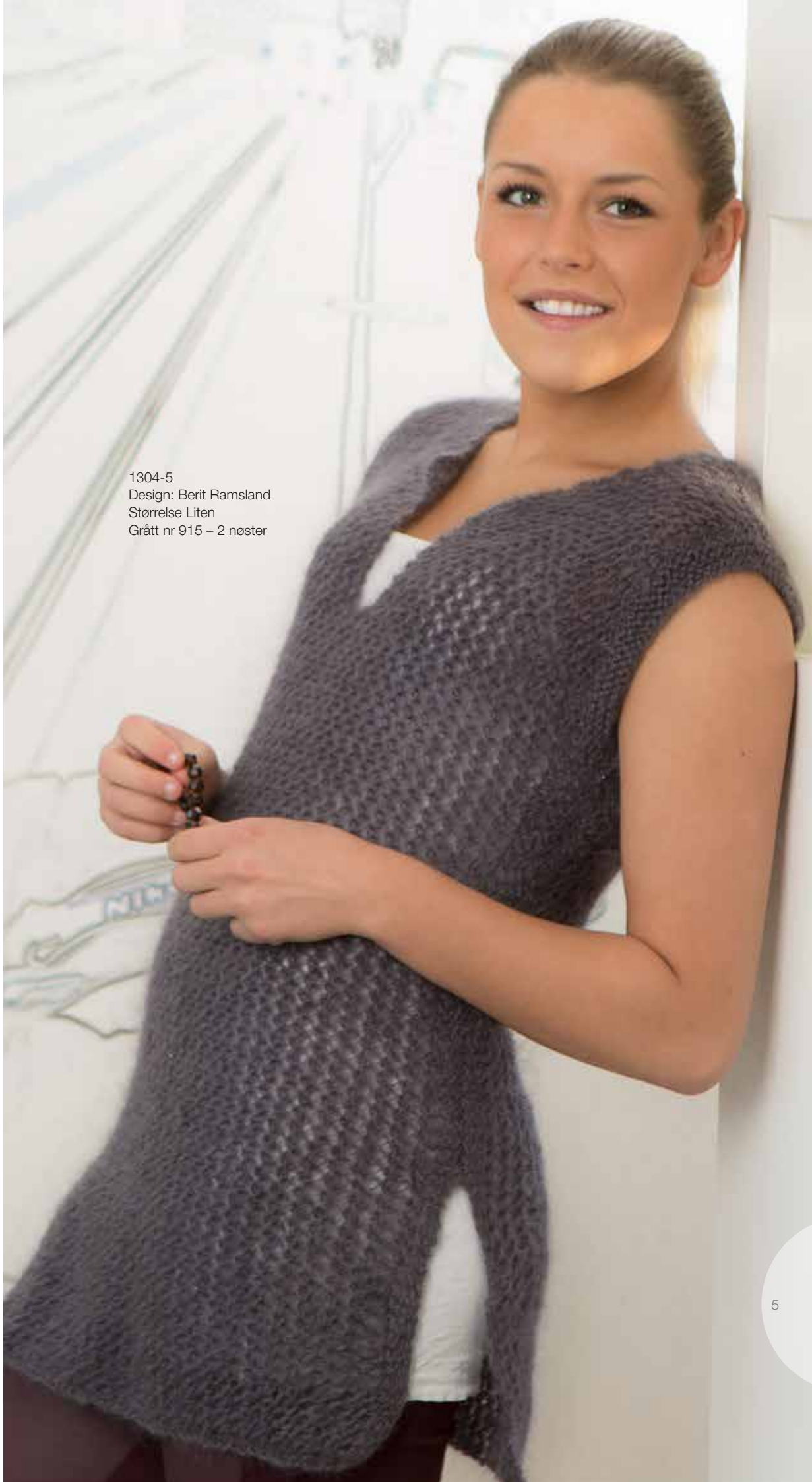
1304-5 Design: Berit Ramsland Størrelse Liten Grått nr 915 - 2 nøster