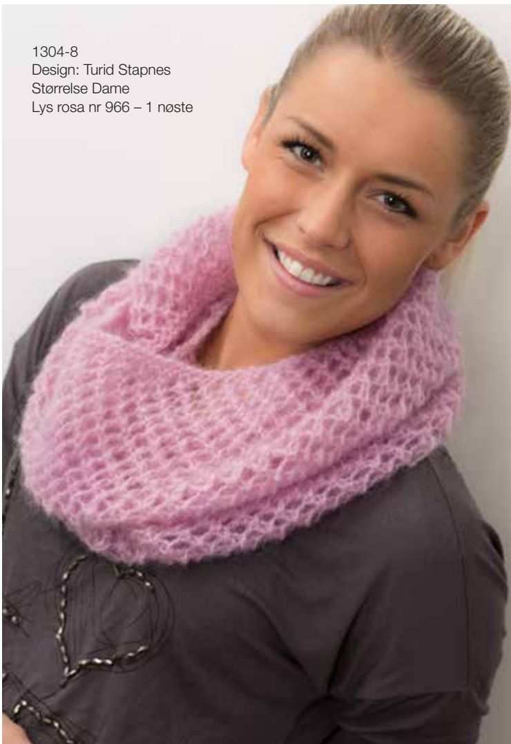
1304-8 Design: Turid Stapnes Størrelse Dame Lys rosa nr 966 – 1 nøste