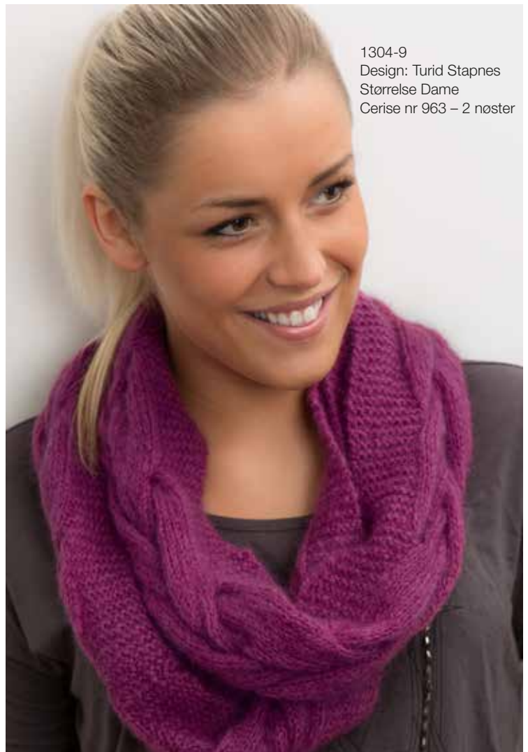
1304-9 Design: Turid Stapnes Størrelse Dame Cerise nr 963 – 2 nøster