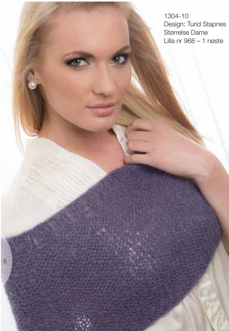
1304-10 Design: Turid Stapnes Størrelse Dame Lilla nr 968 – 1 nøste