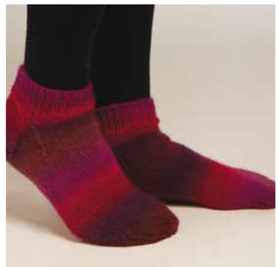
1202-20 Design: Berit Ramsland