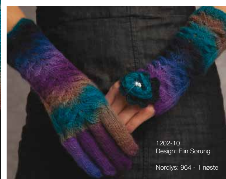
1202-10 Design: Elin Sørung