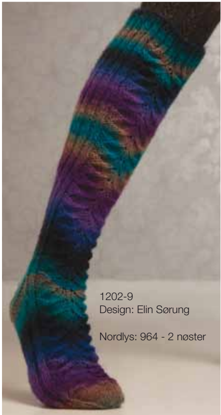
1202-9 Design: Elin Sørung Nordlys: 964 - 2 nøster