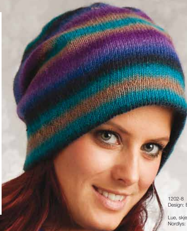
1202-8 Design: Berit Ramsland