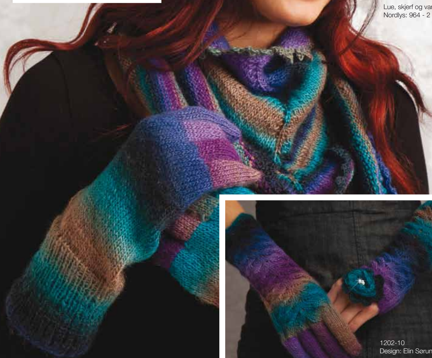
Lue, skjert og vanter Nordlys: 964 - 2 nøster