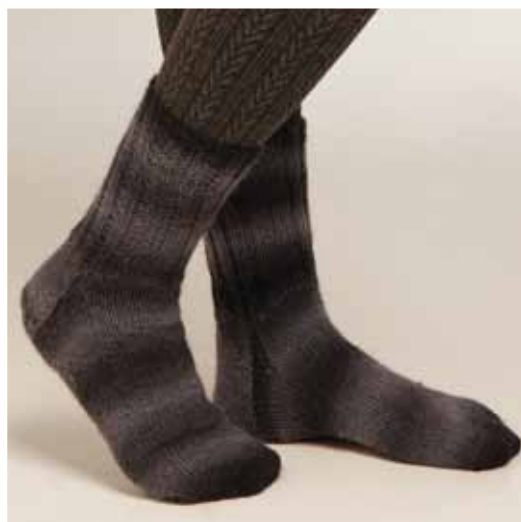
1202-19 Design: Berit Ramsland