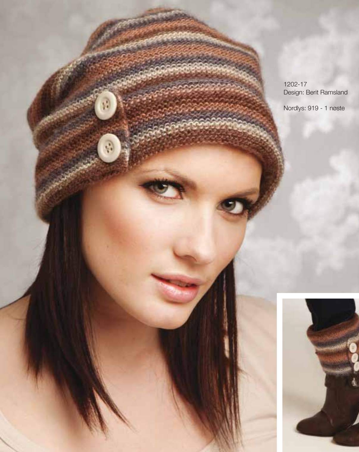
1202-17 Design: Berit Ramsland