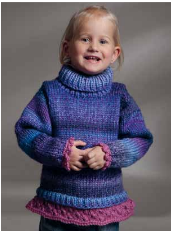
1103-13 Design: Berit Ramsland