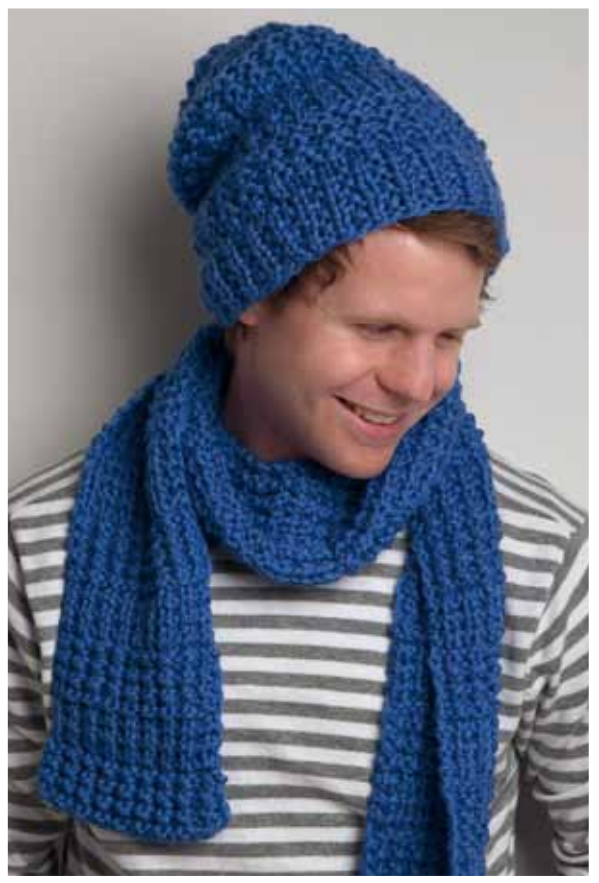
1103-19 Design: Ann-Kristin R. Knardal