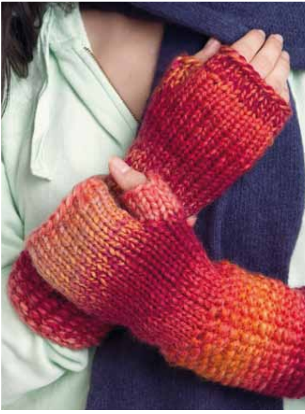
1103-7 Design: Evy Svensson