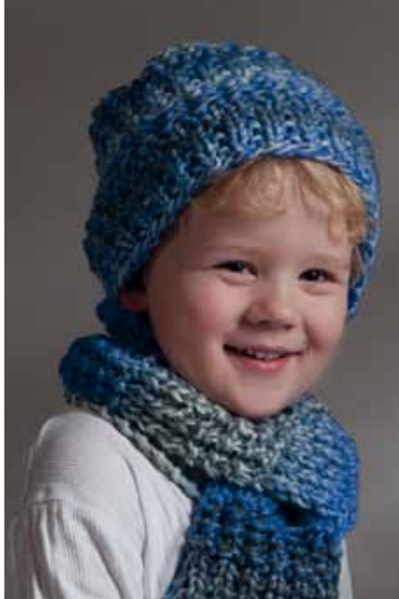
1103-17 Design: Ann-Kristin R. Knardal