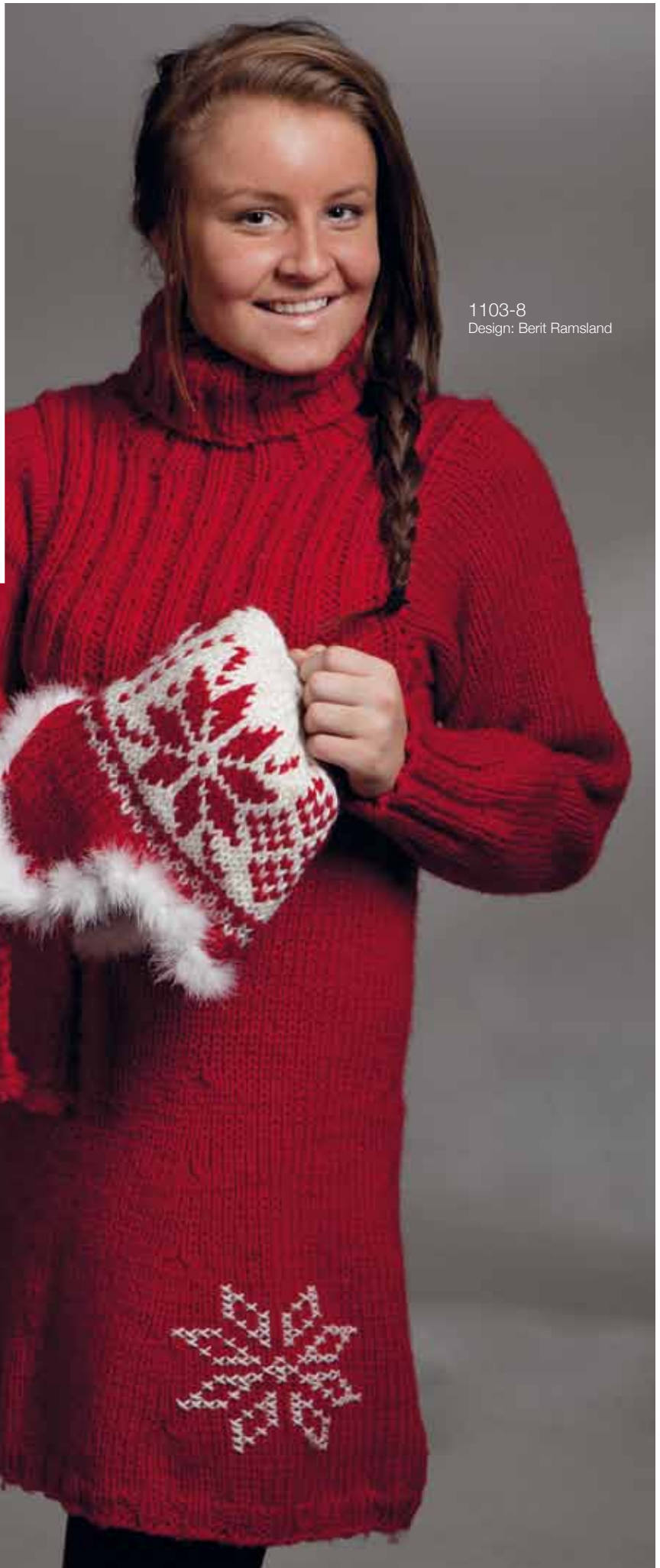
1103-8 Design: Berit Ramland