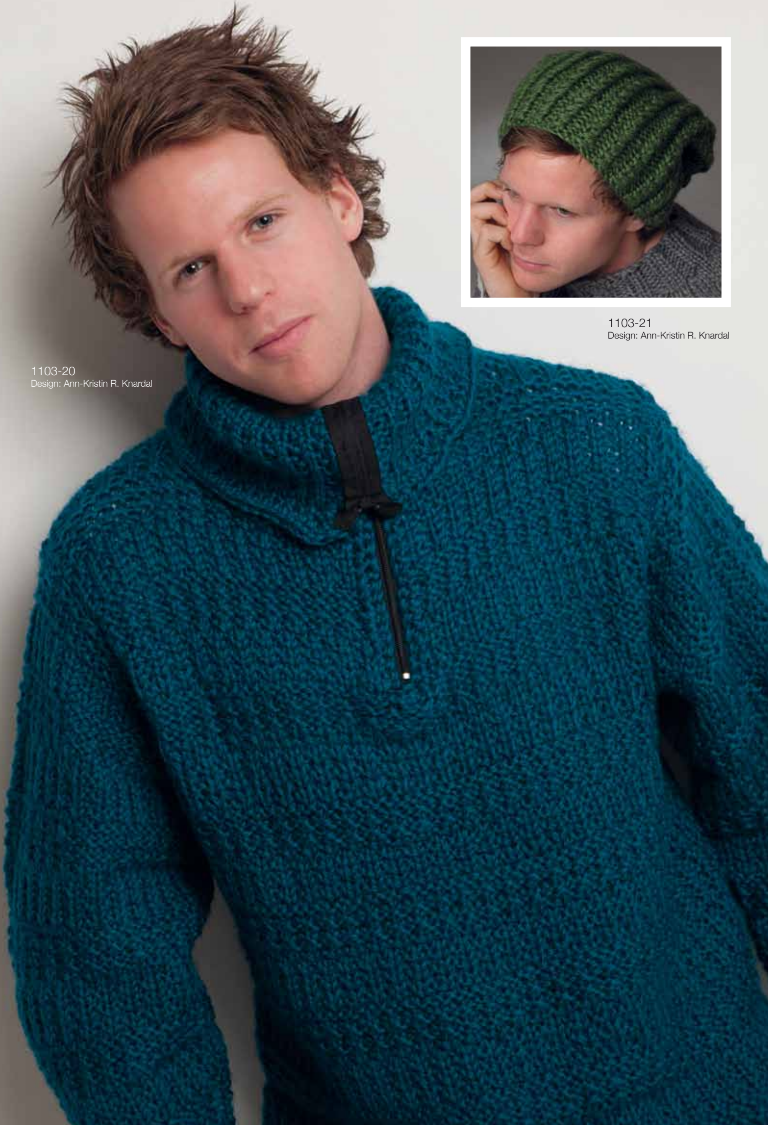
1103-20 Design: Ann-Kristin R. Knardal