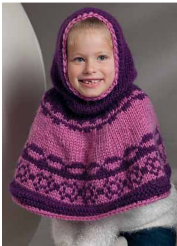
1103-14 Design: Ann-Kristin R. Knardal