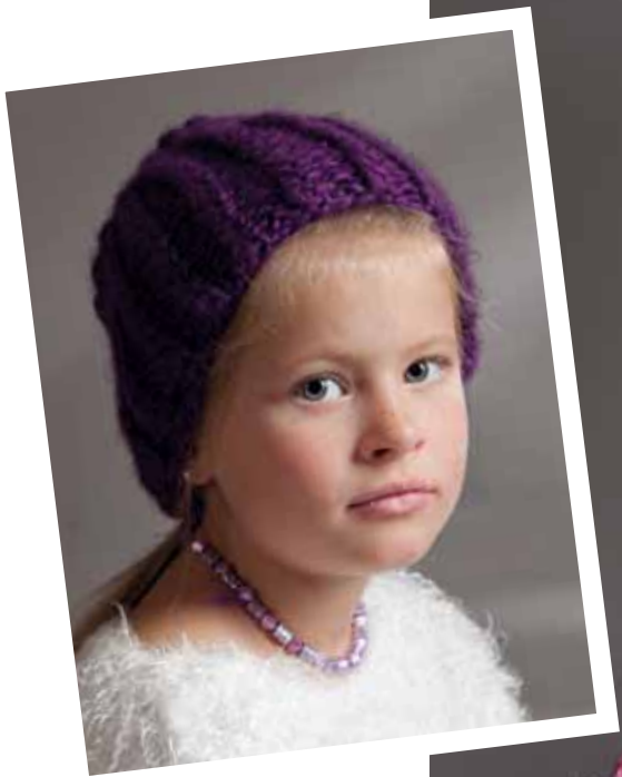
1103-11 Design: Ann-Kristin R. Knardal