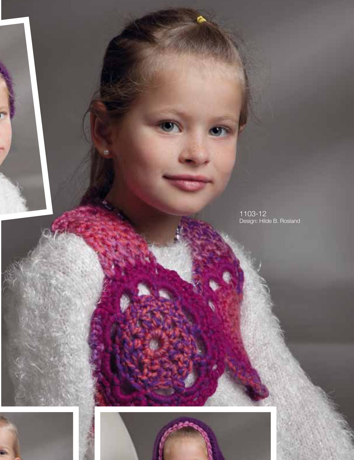
1103-12 Design: Hilde B. Rosland