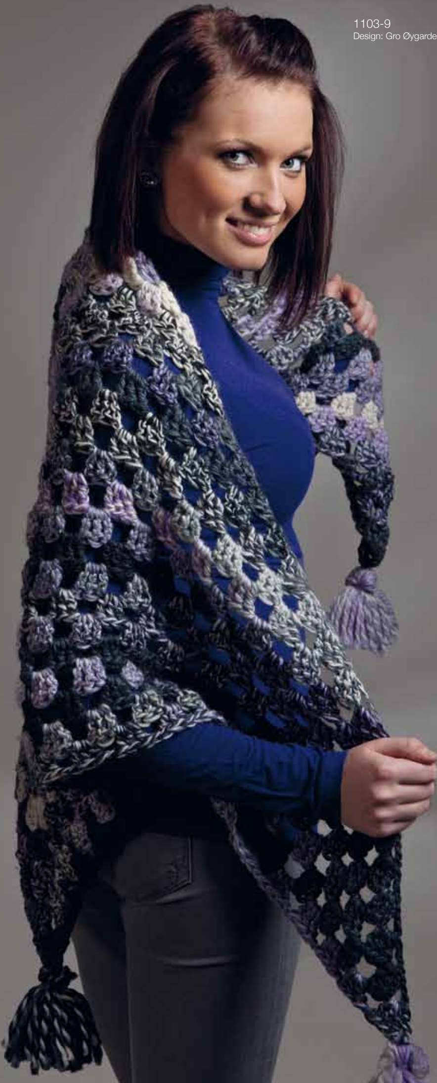
1103-9 Design: Gro Øygarden