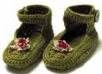
0915-1 Viking Milk&Honey Design: Bente P. Rørvik