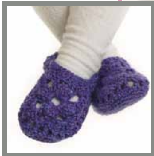
0915-11 Viking Sportsragg Design: Ann-Kristin R. Knardal