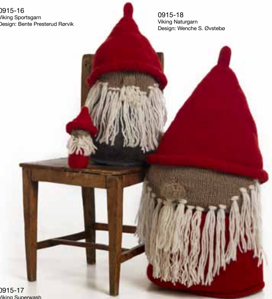
0915-18 Viking Naturgarn Design: Wenche S. Øvstebo