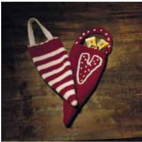
0915-16 Viking Sportsgarn Design: Bente Presterud Rørvik