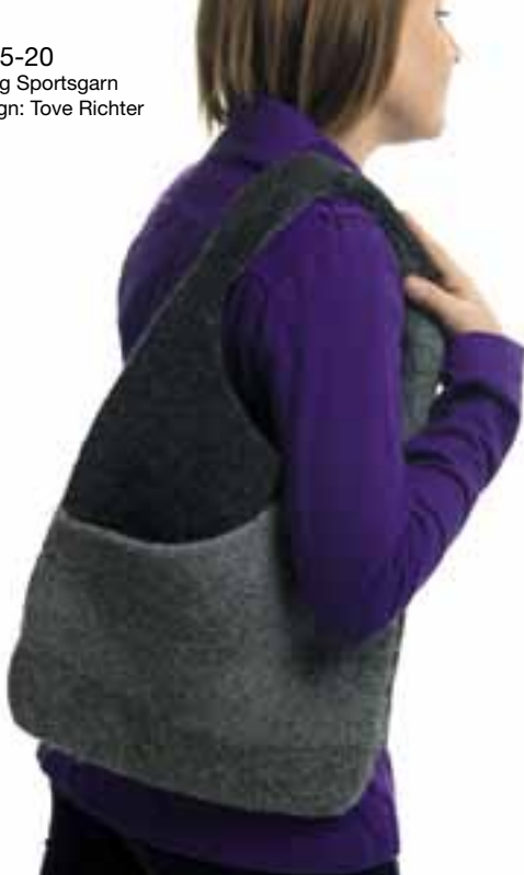
0915-20 Viking Sportsgarn Design: Tove Richter