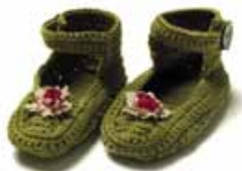
SE SIDE 8