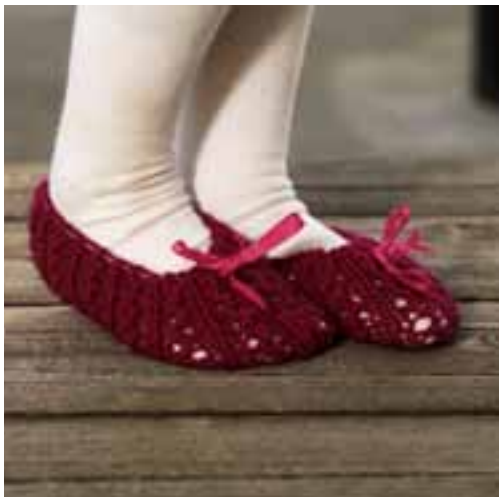
0915-17 Viking Superwash Design: Tove Richter