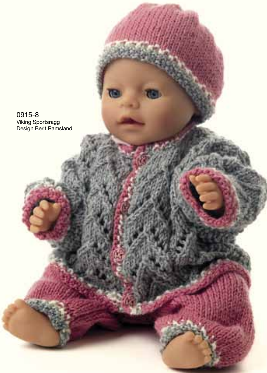
0915-8 Viking Sportsragg Design Berit Ramsland