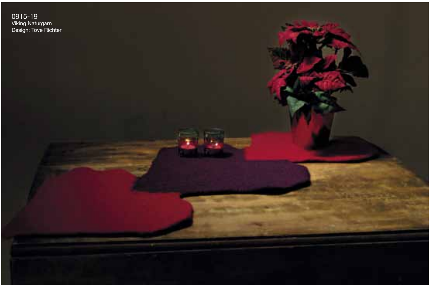
0915-19 Viking Naturgarn Design: Tove Richter