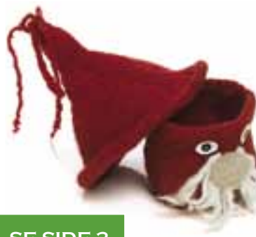
SE SIDE 3