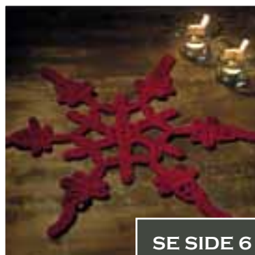
SE SIDE 6

0915-1 Viking Milk&Honey Design: Bente Presterud Rorvik