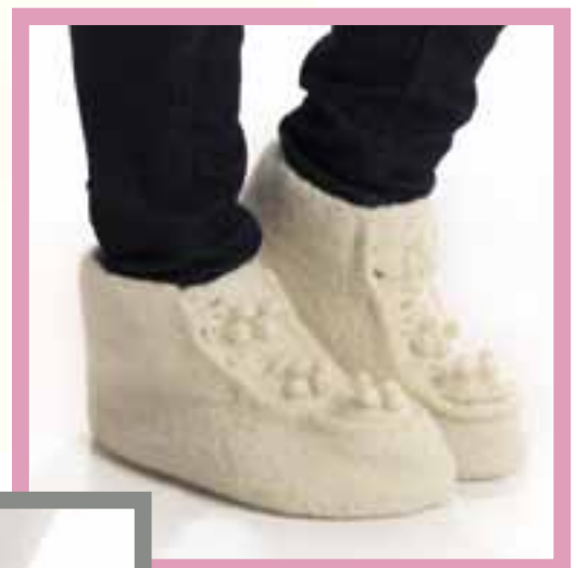
0915-10 Viking Sportsgarn Design: Bente Presterud Rorvik